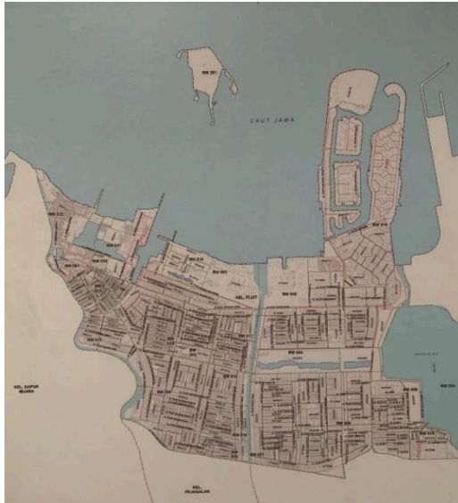
Gambar 2.1. merupakan merupakan Peta dari Wilayah Kelurahan Pluit, Jakarta Utara. Penelitian ini memperoleh gambar tersebut dari Kantor Kelurahan Pluit, Jakarta Utara pada tanggal 29 Oktober 2025. Sisi kiri merupakan wilayah Muara Karang. Sedangkan sisi kanan merupakan wilayah Pluit. Kedua wilayah terpisah oleh sebuah sungai.

Wilayah Muara Karang dan Pluit terhubung oleh tiga jembatan yang berbahan dasar batu. Nama dari ketiga jembatan itu adalah Jembatan Pluit Karang Timur, Jembatan Muara Karang Raya, dan Jembatan Pluit Karang Selatan. Letak Muara Karang berdekatan dengan Pluit dan dibatasi oleh sebuah kali. Diantara kedua wilayah tersebut dibatasi tiga buah jembatan dari batu. Ketiganya dikenal dengan sebutan: