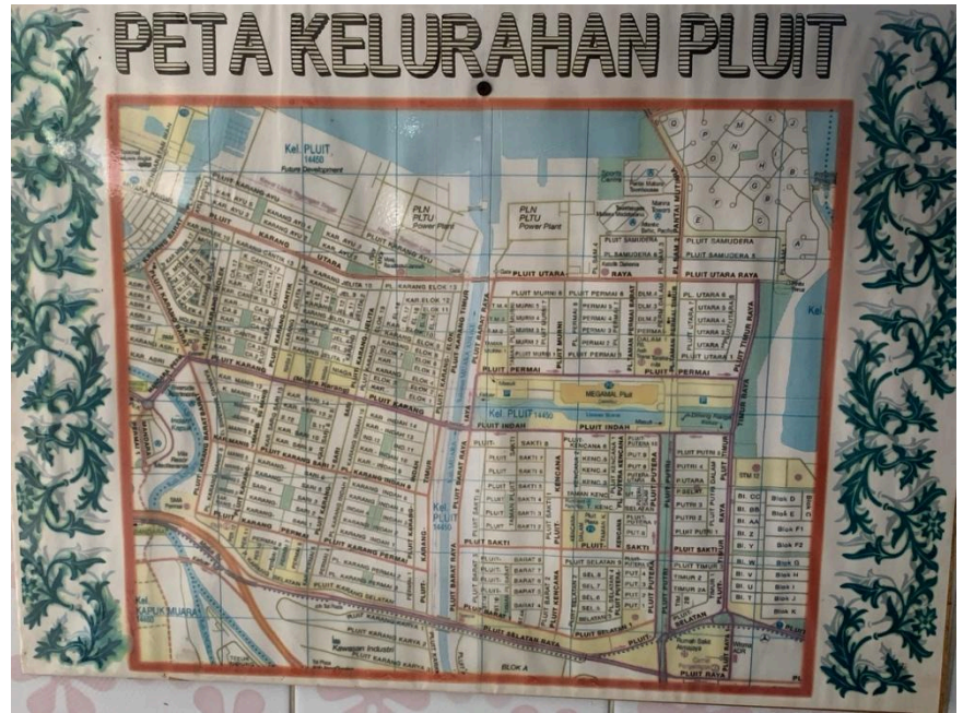
Gambar 3.2: Peta Kelurahan Pluit