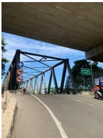
Gambar 2.2: Jembatan Hati

Pada tahun 2020, dibangun dua jembatan baru dari besi yaitu Jembatan Hati dan Jembatan Nurani. Kedua jembatan tersebut menjadi akses bagi orang-orang dari berbagai tempat untuk berkunjung ke wilayah Muara Karang. Berikut ini merupakan gambar dari tiga jembatan tersebut yang diperoleh oleh penelitian ini: