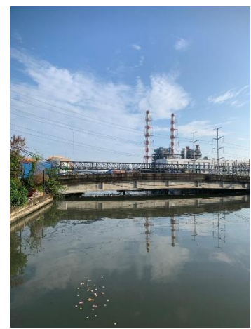
Gambar 2.3: Jembatan Pluit Karang Timur