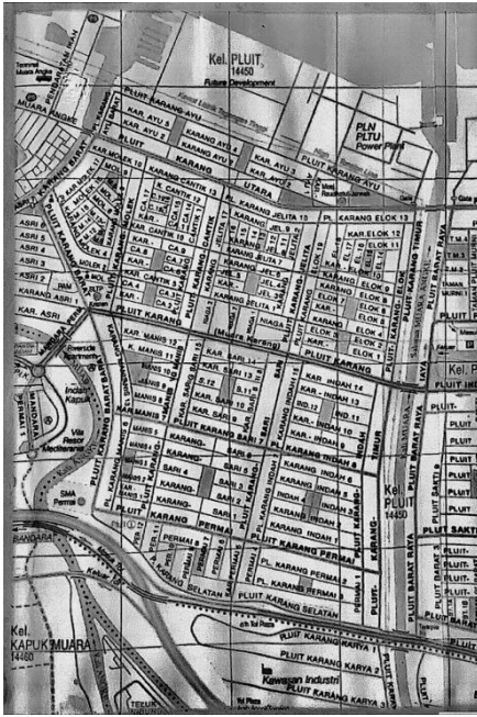
Gambar 3.1: Peta Muara Karang.