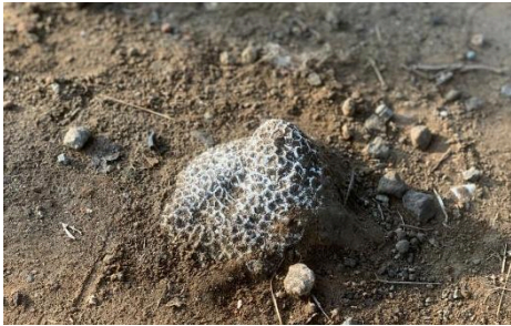
Gambar 1.1: Karang

wilayah Jakarta Utara yang dekat dengan laut. Sehingga sebagaimana dengan sejumlah daerah lainnya di Jakarta Utara, penamaan perumahan tersebut menggunakan kata-kata yang bertema lautan dan pesisir.